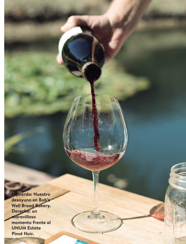
Izquierda: Nuestro desayuno en Bob's Well Bread Bakery. Derecha: un maravilloso momento frente al UNUM Estate Pinot Noir.