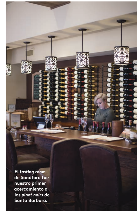
El tasting room de Sanford fue nuestro primer acercamiento a los pinot noirs de Santa Barbara.