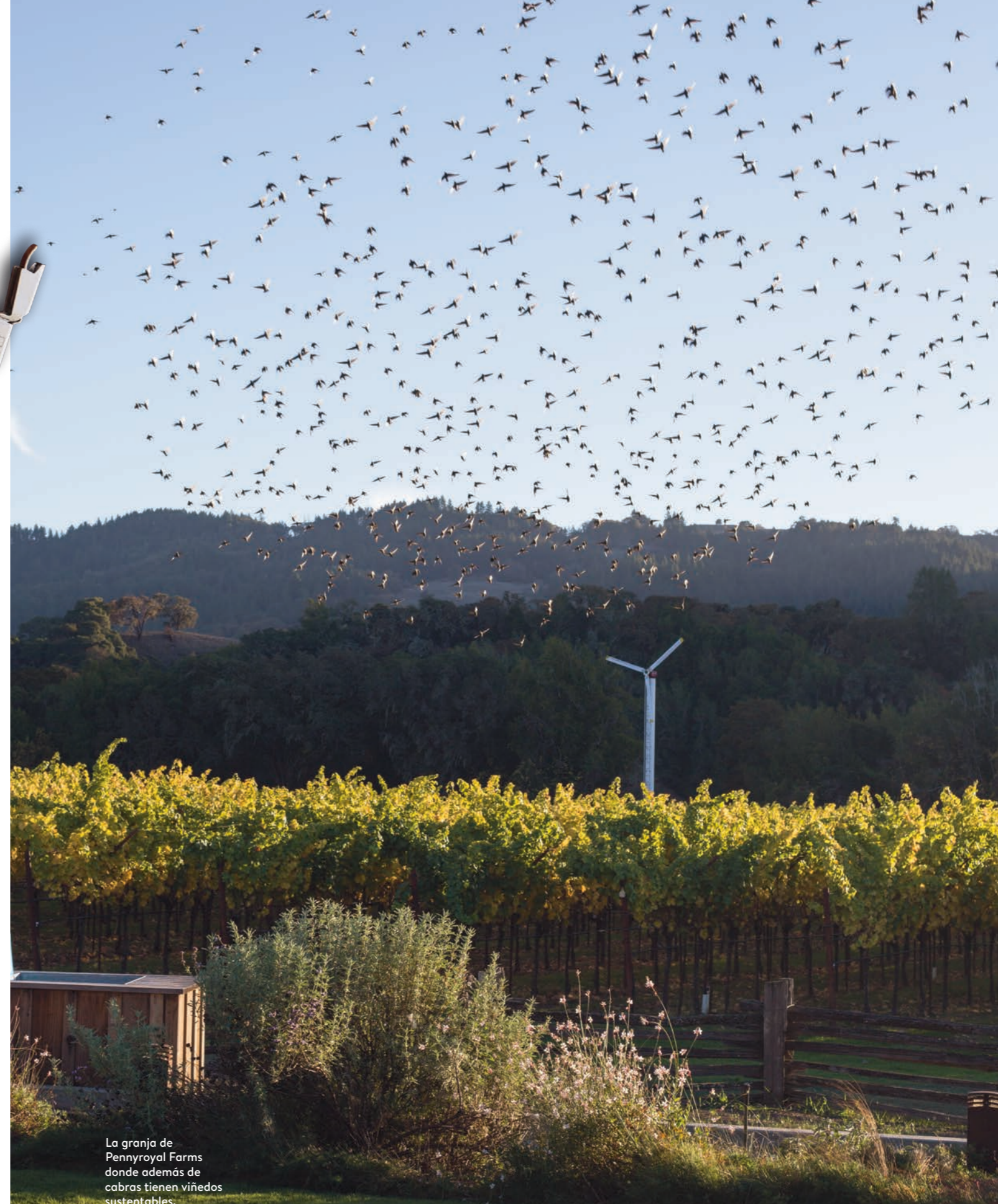
La granja de Pennyroyal Farms donde además de cabras tienen viñedos sustentables.