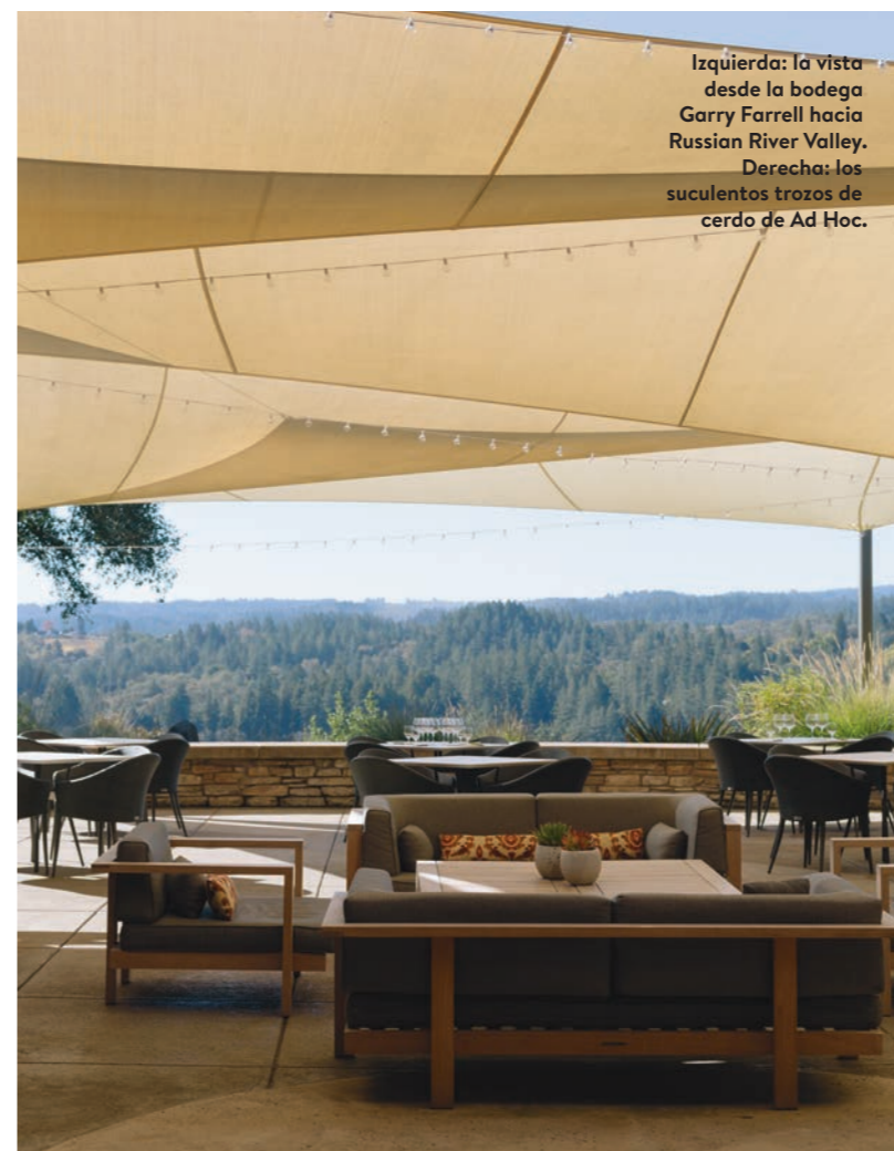
Izquierda: la vista desde la bodega Garry Farrell hacia Russian River Valley. Derecha: los succulentos trozos de cerdo de Ad Hoc.